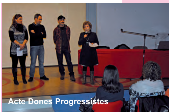
Acte Dones Progressistes

La programació de les Jornades també va comptar, el dia 7, amb la dramatització de textos sobre la dona, pels alumnes de l'Escola Municipal de Teatre de Massanassa.