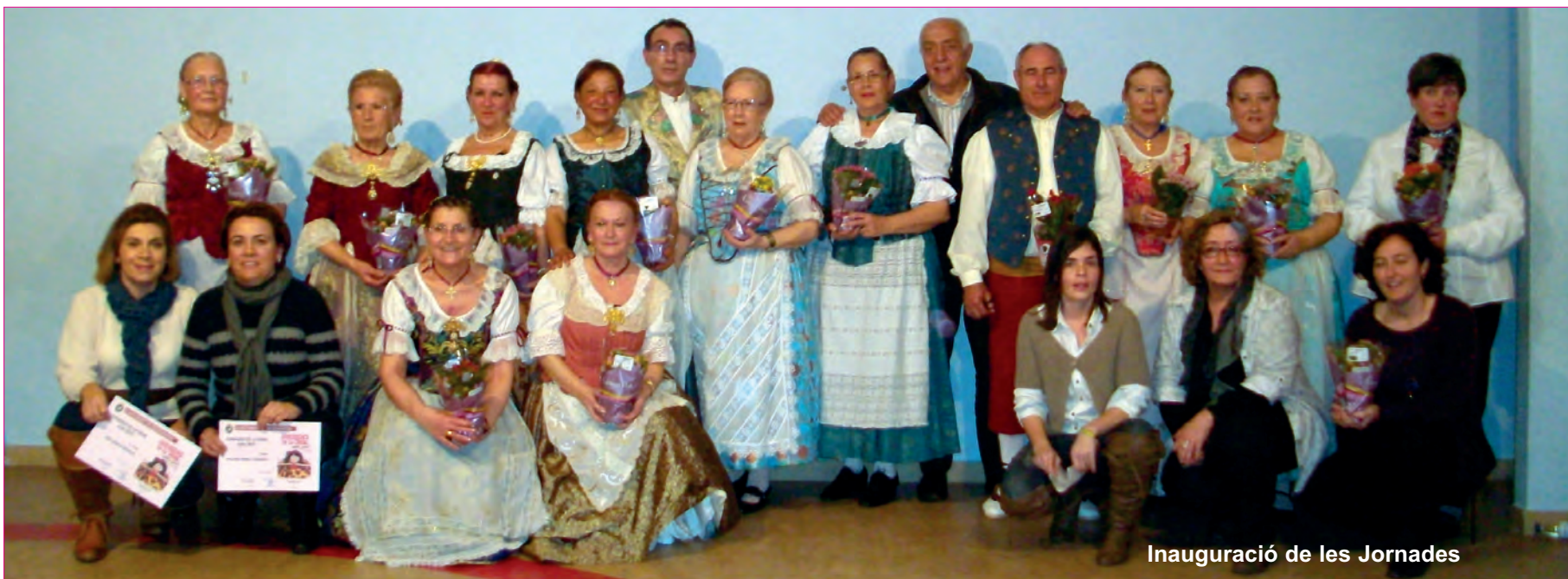
Inauguració de les Jornades