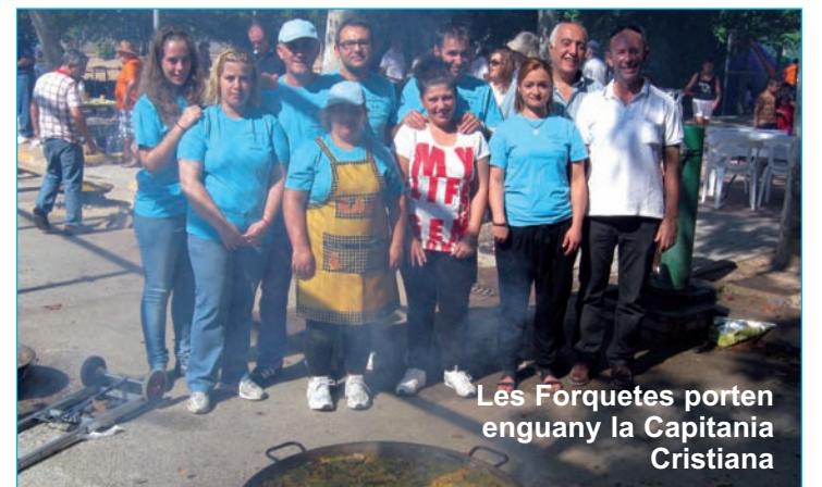
Les Forquetes porten enguany la Capitania Cristiana