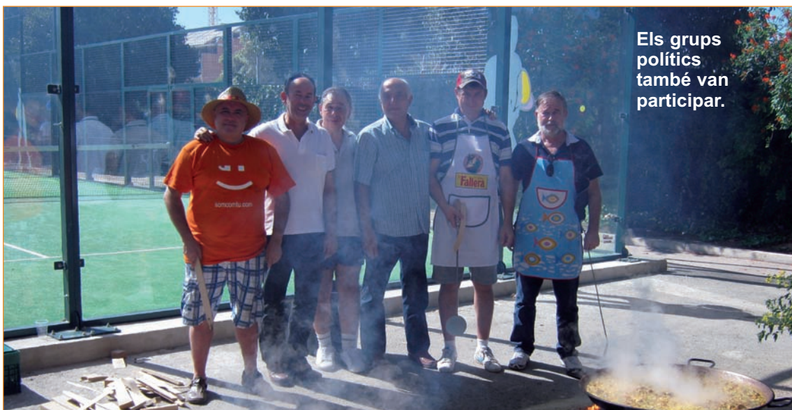
Els grups polítics també van participar.

D'aquesta manera, la jornada del 9 d'Octubre s'ha viscut en el Poliesportiu municipal de Massanassa amb molta germanor i molt bon ambient. No van faltar ni "els