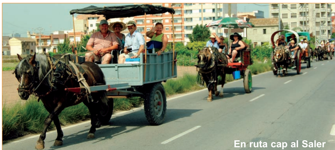
En ruta cap al Saler