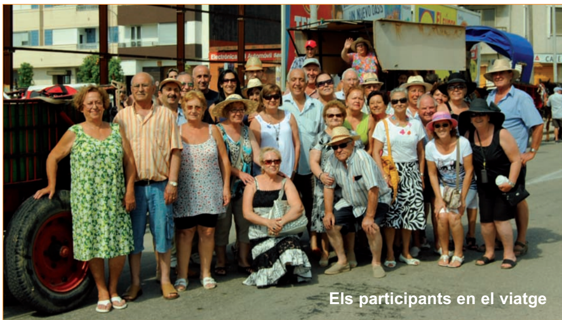
Els participants en el viatge