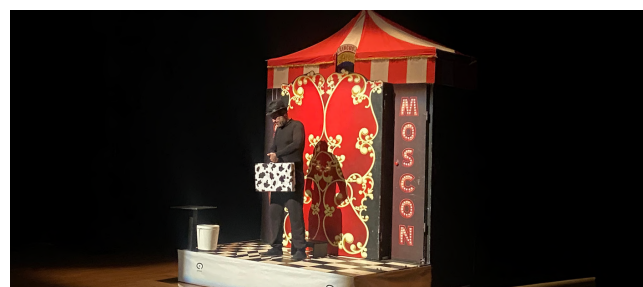
The Show Moscón Espectacle familiar del 18 de desembre de 2022.