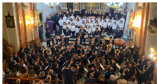
Concert de Nadal 18 de desembre de 2022. Orfeó Polifònic de Massanassa, Banda de Música del CIMM i Cor Infantil del CEMM.