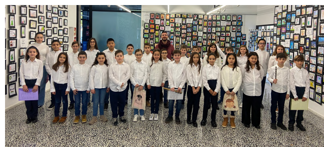
Cor Infantil del Centre d'Estudis Musicals de Massanassa (CEMM) i el seu director Concert del 18 de desembre de 2022. Exposició de les Targetes de Nadal a la Sala Gabriel Cualladó.