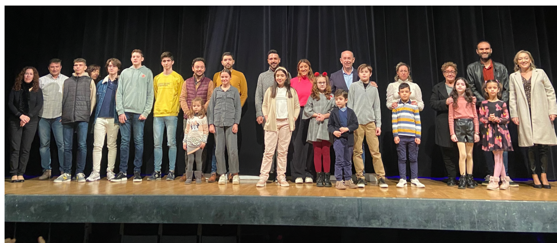
Lliurament dels premis del Concurs de les Targetes de Nadal 2022 Guanyadors i guanyadores, Alcalde i corporació municipal i equip directiu del CEP Lluís Vives i del Colegio San José y San Andrés.