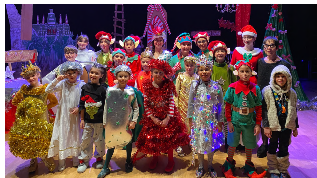
Escola Municipal de Teatre Infantil Funció de Nadal del 17 de desembre de 2022: Un Nadal més que complicat!