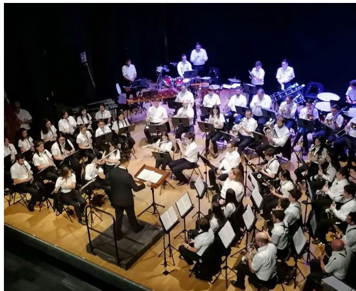
Massapor i XXVII Festes del 9 d'octubre | pàg. 5