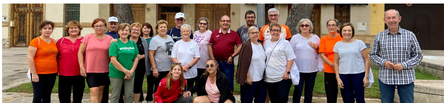
Massanassa Saludable | pàg. 6