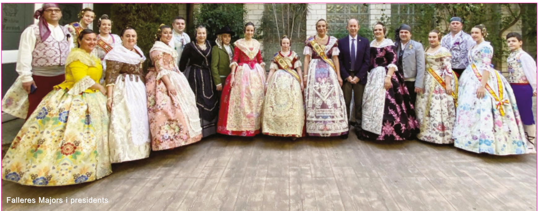
Falleres Majors i presidents

Com l'au Fènix, la nostra revista Festiva i Literària La Terreta tornarà en 2021 recuperant la seua esplendor i ens recordarà com un somni la pandèmia del coronavirus, la Covid 19.